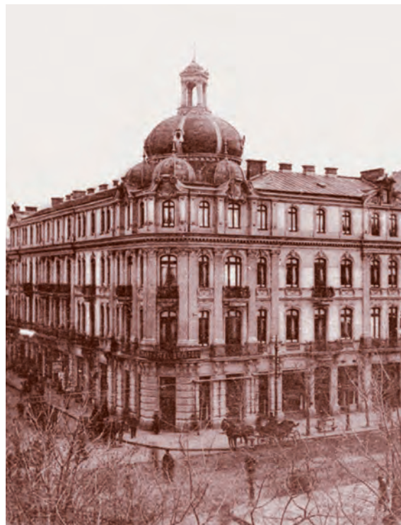
Hotel Bristol din București care, la începutul secolului al XX-lea, găzduia la parter și o cafenea. M.N.I.R.

apărute începând cu ultimele decenii ale secolului al XIX-lea, scade în capitală, ajungând în 1934, potrivit Ghidului Oficial al Bucureștilor, la doar 15 12 , nemaîntâlnindu-se nume cu rezonanță precum High Life, Kübler sau Terasa Oteteleşanu, dispărute deja. Apar în schimb noi cafenele, printre care Wilson pe Bulevardul Brătianu, Regal