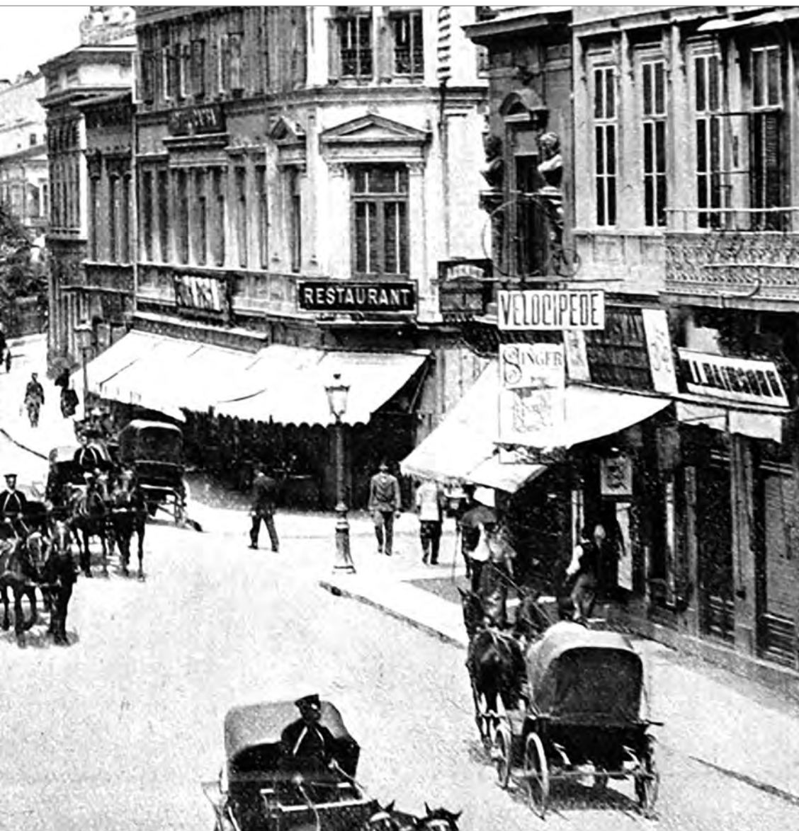
Calea Victoriei, la 1880, cu hotelul și restaurantul Luvru, astăzi Capitol. În dreapta, hotelul și restaurantul Capșa. Muzeul Municipiului București