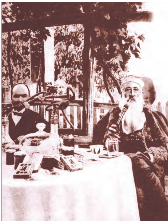
Instantaneu într-o cafenea de pe vechea insulă dunăreană Ada Kaleh, către sfârșitul secolului al XIX-lea.