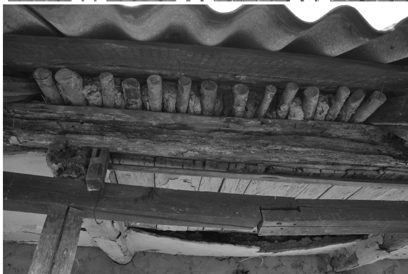
Ce a mai rămas din casa-școală: aripa lungă a clădirii, în imagine ușa de acces în școală, prin capătul lung; alături se văd materialele originale ale construcției. Mana, august 2010.