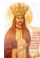
Sfântul Voievod Neagoe Basarab