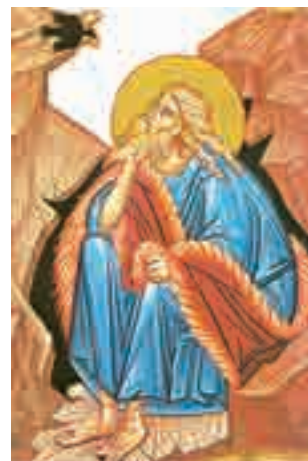
Sfântul Proroc Ilie