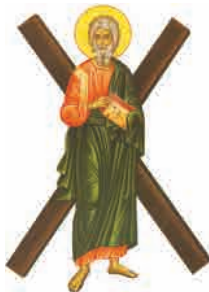
Sfântul Andrei (†30 noiembrie)

✿ Pământul strămoșesc este presărat cu biserici, mănăstiri, sfinte moaște, peșteri sfinte, urme ale viețuirii sfinților și ale mărturisirii credinței creștine pe aceste meleaguri.