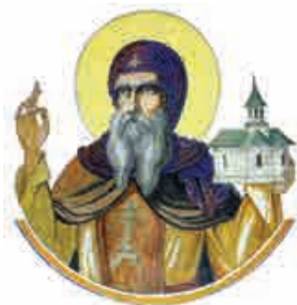
Sfântul Cuvios Nicodim de la Tismana (†26 decembrie)

2. „Să păstrăm valorile țării!” Confeționează un afiș prin care îi îndemni pe cetățenii din localitatea ta să contribuie la protejarea unei biserici sau mănăstiri cu valoare istorică sau culturală pentru țară. Poți face apel și la autorități pentru a se implica în inițiativa ta.