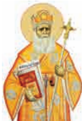
Sfântul Ierarh Andrei Șaguna (†30 noiembrie)

d. Sfântul Cuvios Grigorie Decapolitul d. 27 octombrie