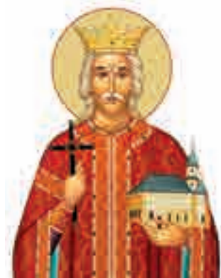
Sfântul Voievod Ștefan cel Mare (†2 iulie)