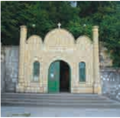
Peștera Sfântului Andrei

🌀 Participă la un pelerinaj la Peștera Sfântului Andrei sau citește despre aceasta pe internet.