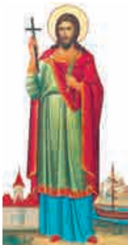
Sfântul Ioan cel Nou (†2 iunie)