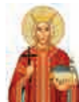
Sfântul Voievod Ștefan cel Mare