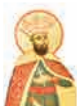
Sfântul Voievod Constantin Brâncoveanu

4. Mulți voievozi ai Țărilor Române au ctitorit lăcașuri sfinte care dănuie peste timp, mărturie a dragostei lor și a poporului român pentru Dumnezeu. Descoperă ctitoriile celor trei sfinți domnitori, urmând firul istoriei. Scrie-le în caiet.