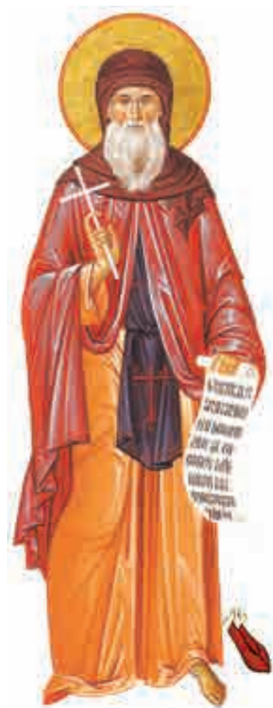
Sfântul Cuvios Dimitrie cel Nou (†27 octombrie)

Caută pe internet cum au fost descoperite moaștele Sfântului Cuvios Dimitrie cel Nou, considerat „ocrotitorul Bucureștiului”.