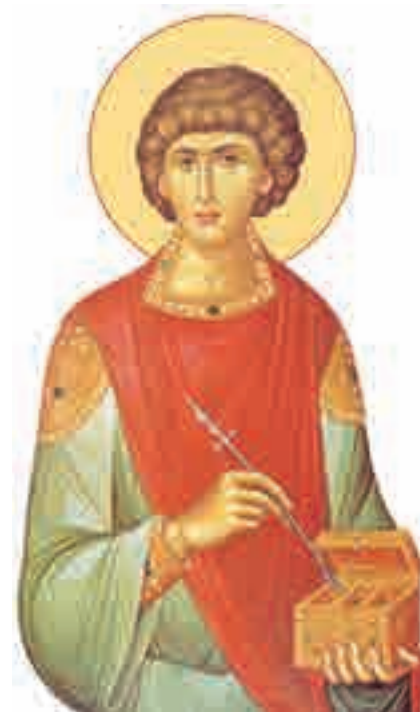
Sfântul Mucenic Pantelimon (†27 iulie)

„Dacă ți-a făcut un bine cineva, să ții minte toată viața, iar dacă tu ai făcut cuiva un bine, să uiți pentru totdeauna!”