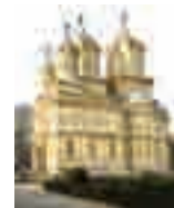
Mănăstirea Curtea de Argeș