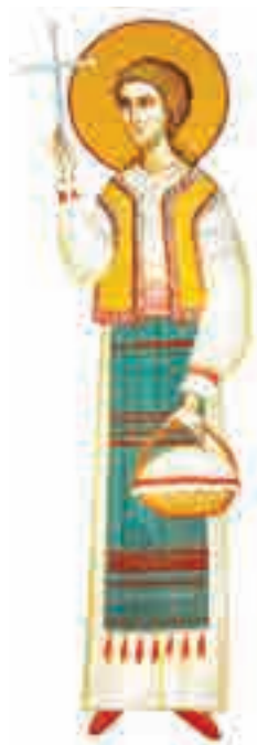
Sfânta Filofteia (†7 decembrie)