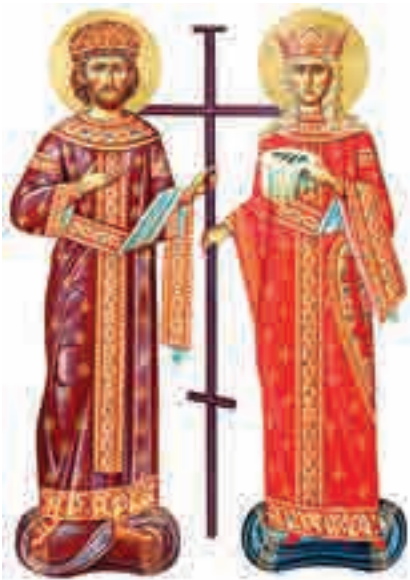
Sfinții Împărați Constantin și Elena (†21 mai)