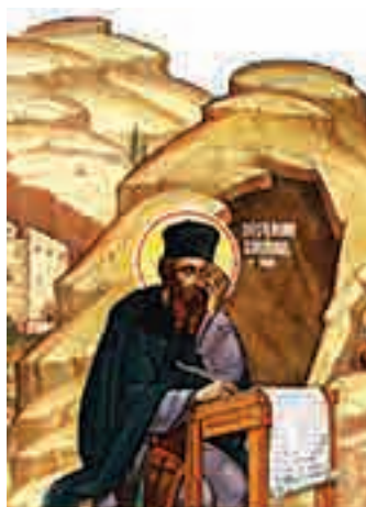
Sfântul Cuvios Ioan Iacob

2. Stabilește cel puțin două asemănări și două deosebiri între sfinții din icoanele de mai jos. Notează-le în caiet, într-un tabel.