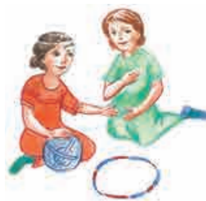
Joc de copii

2. Citește lectura. Realizează o compunere de cel mult 5 rânduri, în care să ilustrezi importanța buneii înțelegeri și a buneii comunicări între oameni. Folosește cel puțin 5 termeni întâlniți în poezie. Inspira-te din viața personală și din desenul alăturat.