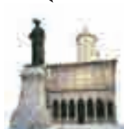
Biserica Sfântul Gheorghe Nou