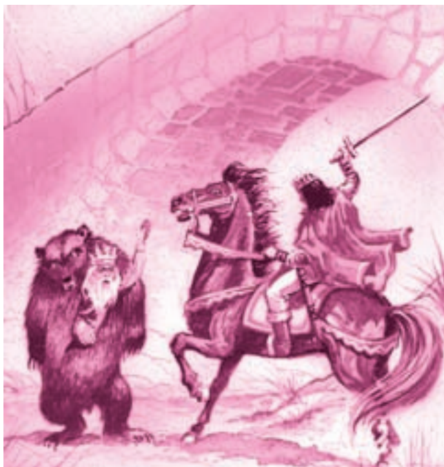
Ilustrație de Walter Riess

Argumentați, cu elemente din text, natura reală sau fantastică a spațiului în care se petrece acțiunea din fiecare secvență.