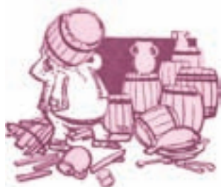
Ilustrație de Roni Noel

Personajul antagonist este construit prin antiteză față de personajul principal sau față de alte personaje.