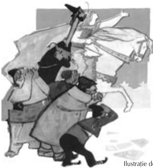
Ilustrație de Roni Noel

• Oralitatea devine, în acest context, componenta stilistică fundamentală a prozei lui Creangă. „Acestui scop suprem îi sunt subsumate cele mai multe dintre procedeele artei sale. Comunicarea cititorului cu marele humuleștean beneficiază, prin aceasta, de un spor de autenticitate, în stare să creeze iluzia unui colocviu intim, dincolo de vreme.” (Gh. I. Tohăneanu)