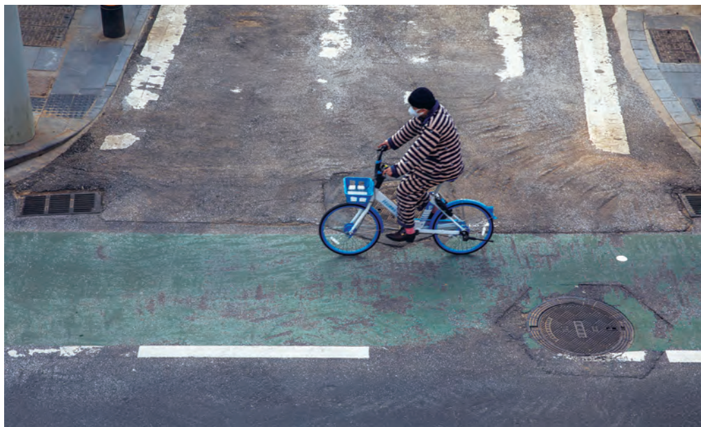
Întrucât circulația automobilelor personale este interzisă, oamenii se folosesc de biciclete.