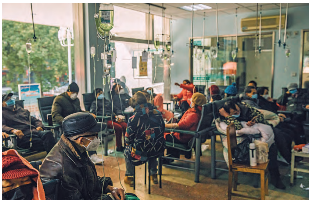
Spitalul nr. 7 din Wuhan plin de pacienți.