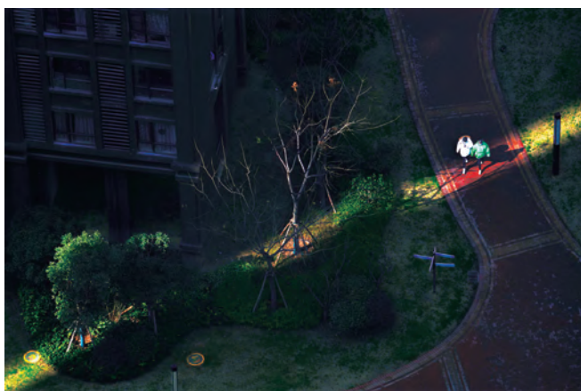
Localnici purtând mască în bătaia unei raze solare, 30 ianuarie 2020, a opta zi de izolare.

Acel video m-a făcut să cred că acest oraș este plin de speranță și iubire. Una dintre prietenele mele mi-a spus: „Cred că, după trecerea epidemiei, fie că rămânem, fie că plecăm, vom iubi mai mult acest oraș.”