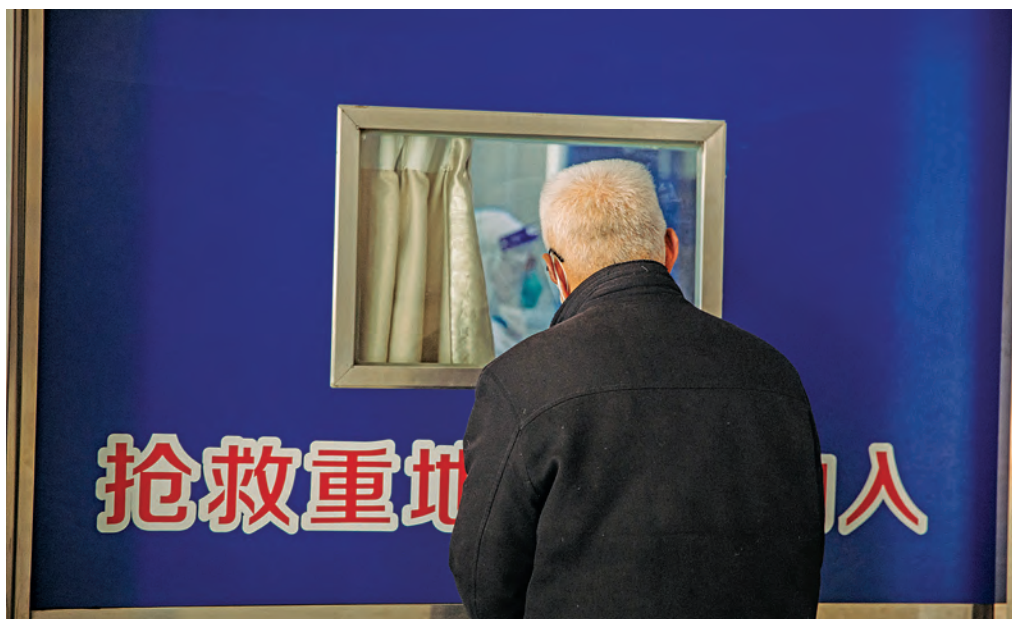
Un bătrân urmărește cum soția lui bolnavă primește tratament.