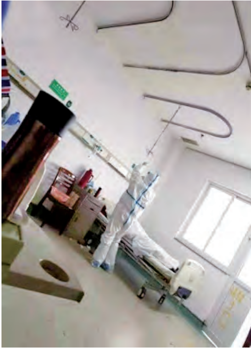
O asistentă verifică perfuzia unui pacient dintr-o rezervă.

Nu era o situație normală, în care membrii familiei să poată avea grijă de pacienți, ușurând astfel activitatea personalului medical. Acum, toată munca era făcută de cadrele medicale, inclusiv servirea hranei, aruncarea gunoaielor, igienizarea și îngrijirea pacienților, la care se adăugau o serie de alte sarcini care îi puneau în situații de risc. Dacă nu vezi asta cu ochii tăi, nu ai cum să știi prin ce dificultăți au trecut acești oameni. În acele