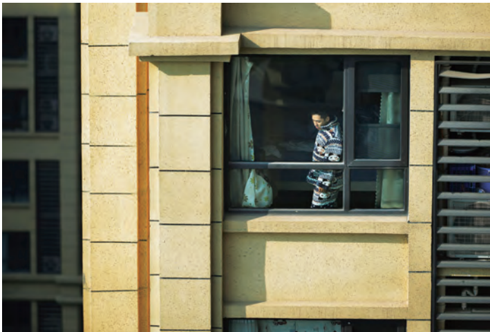
30 ianuarie 2020, a opta zi după închiderea orașului: izolat în casă, un locuitor din Donghucheng privește pe fereastră.

Era o zi însoțită – a doua după închiderea orașului Wuhan. Stăteam pe balcon și lucram la calculator, iar cei doi copii ai mei se jucau lângă mine. Dincolo de fereastră, cearșaful pe care îl spălaserăm flutura în adierea vântului.