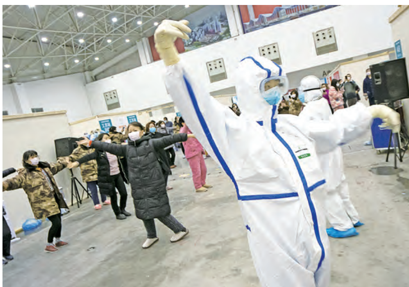
Asistentele le arată pacienților mișcări de dans și exerciții fizice ușoare, pentru a-i ajuta să se destindă.

După declanșarea epidemiei, tehnologia modernă de comunicare le-a permis oamenilor să obțină informații la zi despre situație, însă unora dintre ei le-a și provocat anxietate și panică. Ca urmare, în spitalele temporare au fost introduse și măsuri de psihoterapie. De exemplu, s-a inițiat un mecanism de consiliere psihologică prin participarea unor profesioniști, pacienții au fost încurajați să se ajute unii pe alții, să citească cărți și să își caute pacea interioară și li s-au distribuit materiale cu informații medicale elementare.