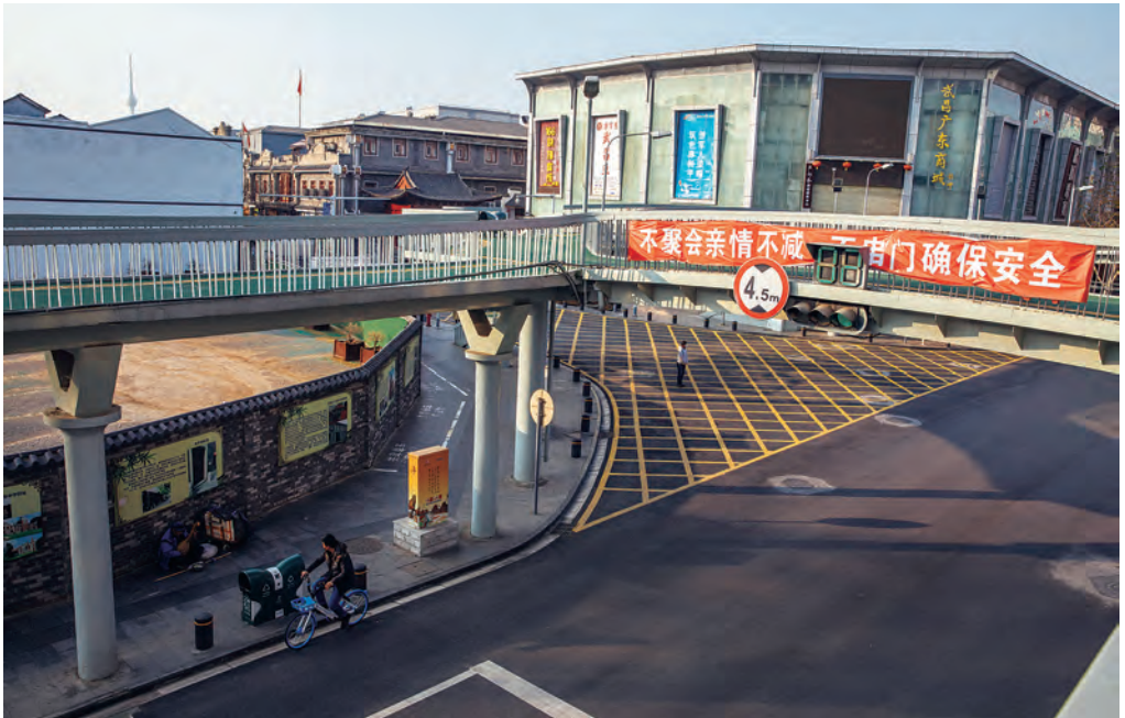
Un bătrân cântând la un instrument muzical sub podul rutier Hubu, necirculat acum.