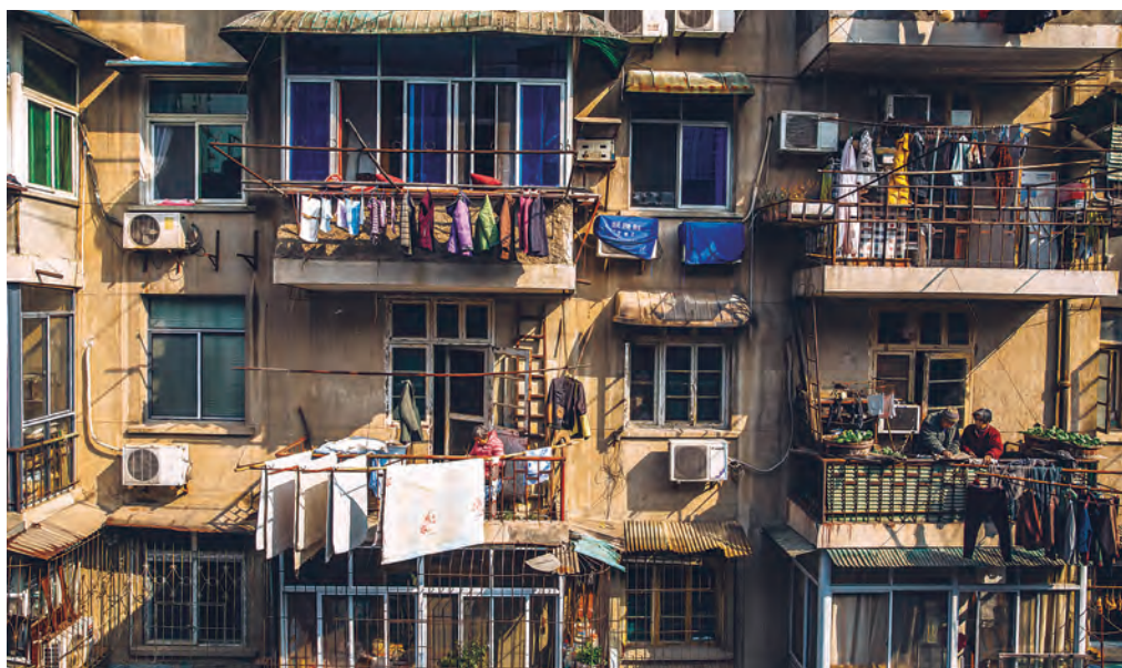
O clădire rezidențială aflată foarte aproape de Spitalul nr. 7. În stânga, o femeie tricotează la soare, iar în dreapta, un vârstnic și soția lui întind rufe la uscat. Această scenă le redă oamenilor speranța că vor reveni la o viață normală.