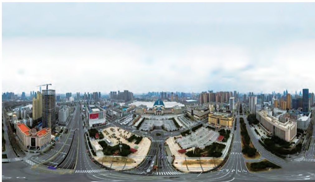
Gara din Wuhan, 28 ianuarie 2020. De obicei, este înțesată de oameni și trenuri.

Nu există supereroi adevărați, ci doar oameni obișnuiți care se remarcă prin curaj în caz de necesitate. Licărirea de lumină poate fi slabă, dar, când se unesc multe puncte luminoase, în cele din urmă ele pot alunga întunericul.