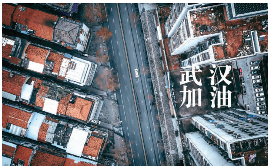
O stradă pustie din Wuhan, 27 ianuarie 2020. Lao Bai a însoțit fotografia cu mesajul: „Fii puternic, Wuhan!”

Fotografiile pot immortaliza istoria și pot încălzi inimile oamenilor precum vorbele.