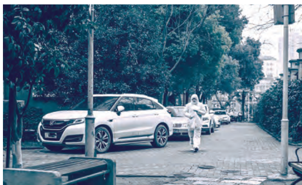
Un lucrător de la salubritate în costum de protecție, 2 februarie 2020.