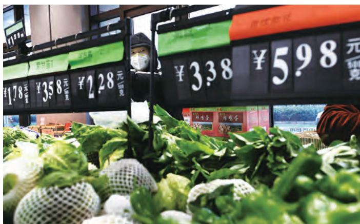
La 24 ianuarie 2020, a doua zi de izolare a orașului, supermarketul Zhongbai din Wuhan dispunea încă de cantități mari de legume proaspete, la prețuri rezonabile.