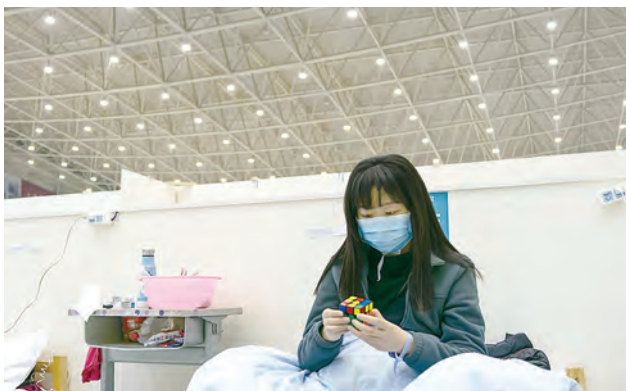
O pacientă se joacă în patul ei cu un cub Rubik.