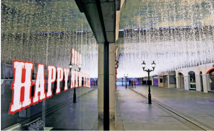
26 ianuarie 2020, a patra zi de izolare: strada Hanjie, cândva aglomerată, acum pustie.